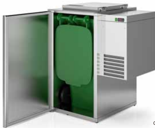
capacidade capacity 480L