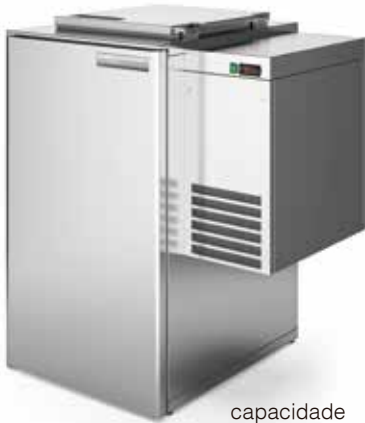
capacidade capacity 240L